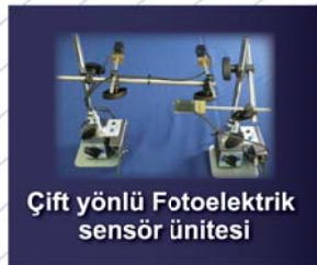
Çift yönlü Fotoelektrik sensör ünitesi

Двигатель переменного тока переменной частоты Variable speed AC motor