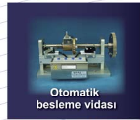
Otomatik besleme vidası

Вертикальный цилиндр Рука робота Vertical cylinder robot arm