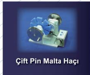
Çift Pin Malta Haçı

2 Way фотоэлектрический датчик 2 Way photoelectric sensor unit