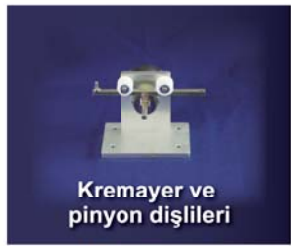
Kremayer ve pinyon dişlileri