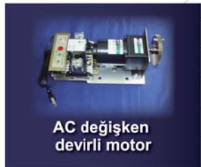
AC deęişken devirli motor

Двигатель переменного тока переменной частоты Variable speed AC motor