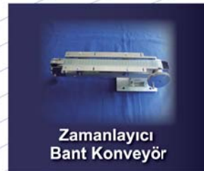
Zamanlayıcı Bant Konveyör

Мальтийский механизм с двумя кривошипами Double pin Geneva drive