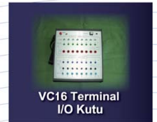
VC16 Terminal I/O Kutu

Распределительная коробка с 16 клеммами VC16 terminal I/O box